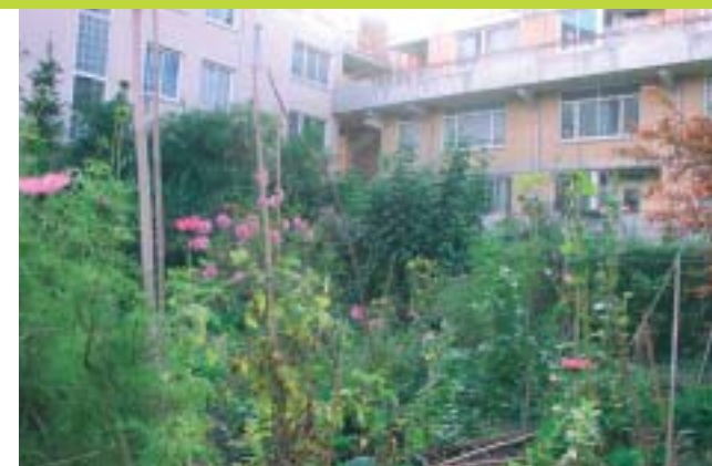
Daktuin in De Pijp

Geef altijd uw mening. Het heeft zin, maar wees wel op tijd! Zorg ervoor dat uw brief binnen de gestelde termijn bij het stadsdeel is. De termijn waarbinnen u kunt reageren, staat in de kennisgeving. Als u niet op tijd reageert, wordt uw mening niet meegewogen. Het niet ontvangen van een stadsdeelkrant is volgens de rechter meestal geen geldig argument om niet op tijd te reageren.