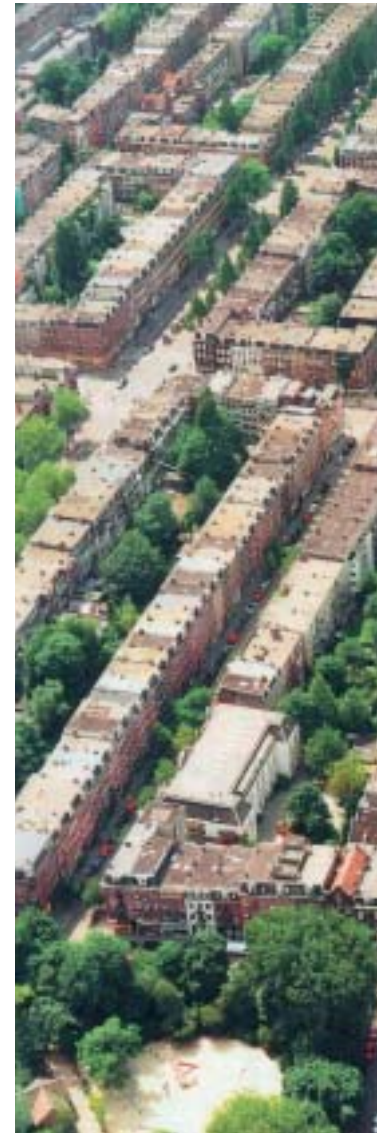
Uitzicht op binnentuinen in De Pijp

Het is natuurlijk gemakkelijk gezegd dat binnentuinen groen moeten blijven en mooier moeten worden gemaakt. Juist omdat we in een stad wonen - vaak dicht op elkaar - spelen er vaak tegenstrijdige belangen. Het is daarom belangrijk te kijken of verschillende meningen en behoeften kunnen worden samengebracht en kunnen leiden tot een oplossing waarin ieders belang wordt gehoord. Met een groen eindresultaat!