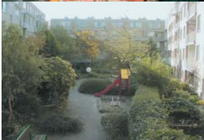
Binnentuin in de 2e Van der Helststraat, in de Pijp