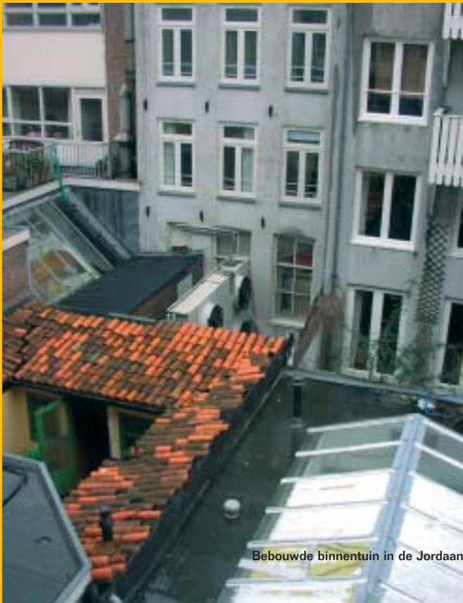
Bebouwde binnentuin in de Jordaan