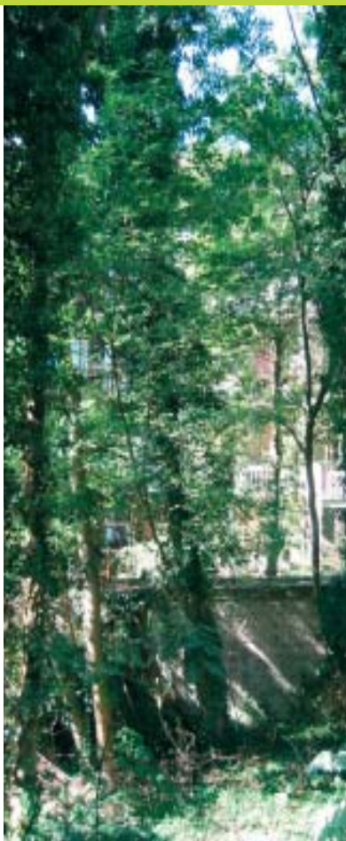
Bomen in tuin in Oud-West

In binnentuinen staan vaak bomen. Als er gebouwd wordt in een binnentuin, moeten bomen soms gekapt worden. Maar kappen mag niet zomaar. In de bomenverordening, de regels over bomen van het stadsdeel, staat wanneer wél en wanneer niet gekapt mag worden. Als een boom een doorsnede van meer dan tien centimeter heeft en 1,3 meter boven maaiveld groeit, moet een kapvergunning worden aangevraagd. Ook hiervoor geldt: u hebt het recht het stadsdeel te laten weten dat u het hier niet mee eens bent. Houd goed in de gaten of er voor bomen in de binnentuin een kapvergunning wordt aangevraagd. Herhaal daarom de stappen twee en drie en eventueel vier.